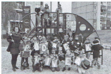
Srem--_Zdjecia z otwarcia_NIVEA_P_2016 (8).jpg ~136 KB