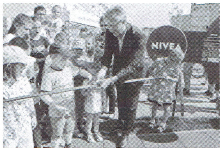
Trzemieszno--_Zdjecia2 z otwarcia_NIVEA_P_2015 (4).jpg ~704 KB